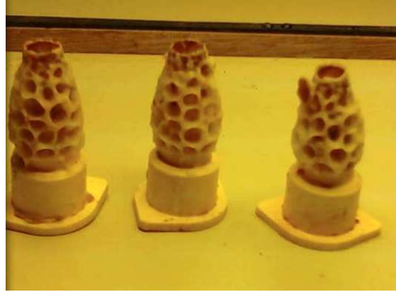
Ingekooide en uitgelopen doppen

De carnica-imkers gingen voor een deel echter nog een stap verder en plaatsten hun te bevruchten koninginnen in Krevrhille, de bevruchtingstand van Corneel Dewindt en het RKH, waar geselecteerde darren kunnen zorgen voor een zuivere bevruchting. Hierdoor bekwamen ze raszuivere koninginnen waaruit ze de volgende jaren zelf teeltstof kunnen betrekken.